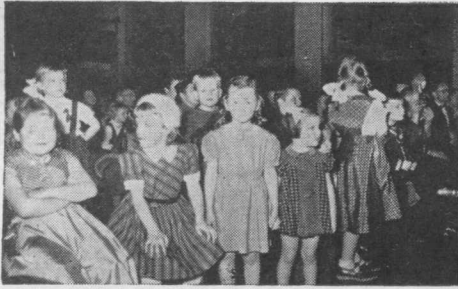
Mažieji vaikų ansamblio žiūrovai.

kad, jei žmogus neranda šioje žemėje savo gyvenimo įprasminimo, nusiraminimo ir pilno pasitenkinimo, tai to įprasminimo reikia ne žemėje, o kur nors kitur ieškoti? Jei žemiškos gėrybės žmogaus nepatenkina, tai turi būti kokia nors kita nežemiška gėrybė, kuri pajėgtų jį patenkinti. Argi neturime teisės galvoti, kad jei žmogaus širdis to įprasminimo ir pasitenkinimo ilgisi, tai turi būti kas nors šalia žemės, kas galėtų jo gyvenimą pilnai įprasminti, nes įgimti prigimties palinkimai ir nujautimai negali būti beprasmiai? Jeigu jau kompasu adatėlė nerimauja, iki atsisojta viena jai skirta kryptimi, kuri egzistuoja ir ją pilnai nuramina, tai ar neturime pagrindo galvoti, kad ir žmogaus širdies ilgesys bei nerimas ir nepasitenkinimas šia žeme šaukiasi ko nors, kas turi būti ir tą širdies ilgesį gali nuraminti?