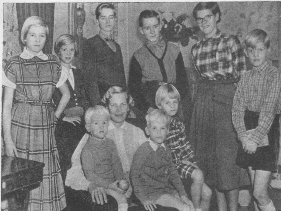
Danų Prekybos Ministeris ponia Lis Groes su devyniais vaikais.

torius. Ir Kristus pasakė, kad šios žemės mažiausieji bus didžiausi danguje. Tie nuostabūs kūdikiai, kuriuose pasireiškia tartum antgamtiški gabumai, gal ir yra šių Kristaus žodžių mažutė iliustracija. Taip, kartais jau ir šiame pasaulyje mažame, kukliame kūdikiyje pasirodo toki sugebėjimai, kuriuos paprastai žmonės pasiekia tik po ilgų studijų ir kruopštaus darbo.