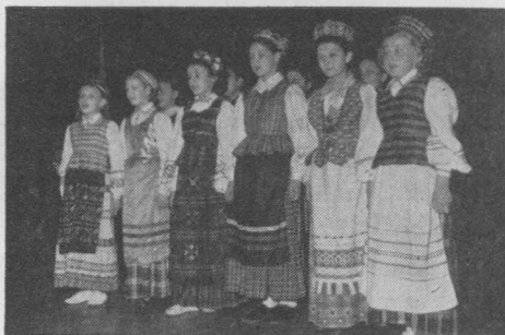
Vaikų Ansamblio dalyvės Čikagoje.

Kas gi žmones jungia? Pirmoje eilėje, žmogiškoji prigimtis. Nesvarbu, kokia žmogaus spalva, rasė, kraujas, kokia kalba, tikėjimas, koks turtas ir socialinė padėtis — kiekvienas žmogus turi tą pačią prigimtį, kuri visus žmones jungia stipriau ir arčiau negu bet kas kita šioje žemėje. Kai keičiasi valstybių sienos, gimsta ir miršta kultūros, kyla ir griūva imperijos — žmogaus prigimtis lieka esmingai ta pati. Net kai tautos, kalbos nyksta, vienišos stovi faraonų piramidės, ir į dangų stiebiasi inkų ir actekų apleisti paminklai — žmogaus prigimtis esmingai nesikeičia. Ji ne tik nesikeičia, bet net šiandien mums neklaidingai skelbia, kad Dievas ją sutvėrė į savo paveikslą ir panašumą. Ir šioje žmogaus prigimtyje, kuri lieka vis ta pati, nyksta skirtumai,