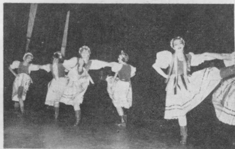
Vaikų Ansamblio šokėjos.

Ar tokie reiškiniai neturėtų sukelti net ir nefanatiškiems netikintiesiems