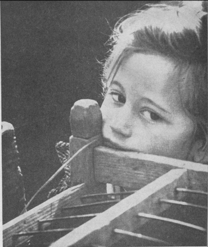
Laukia grįžtant tėvelio, kuri pikti žmonės išvežė...

2. Atsimink, kad ir kažin kaip aiški atrodytų kito kaltė — galima visada rasti švelninančių aplinkybių. Prieš daugelį metų Sioux indėnai turėjo išpūdingą paprotį. Narsuolis, iškeliaudamas aplankyti svetimų kiltčių, pakeldavo rankas į dangų ir