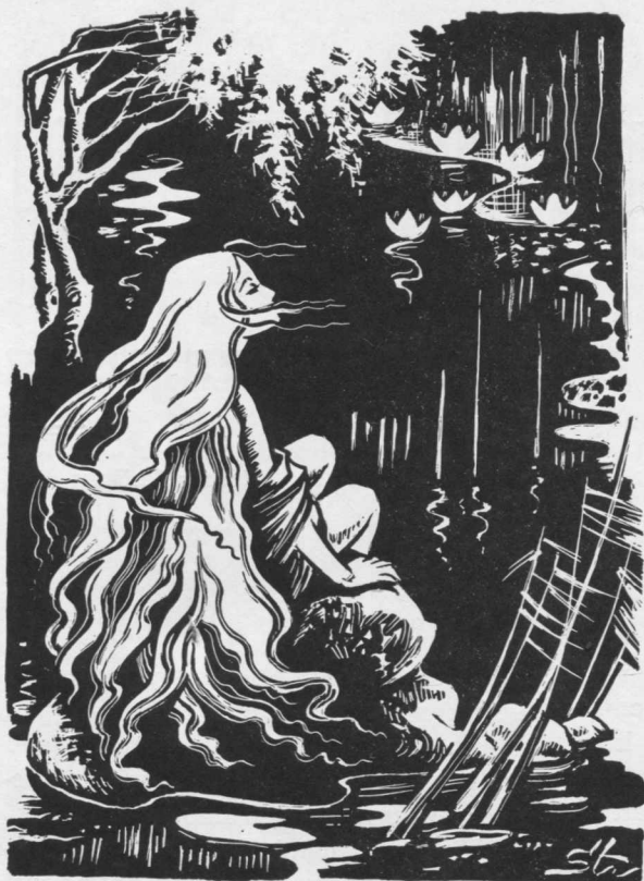
VI. Stančikaitė "Saulės vestuviu" ilustracija

nuo priešo ir, jeigu yra būtinas reikalas, net nužudyti tą, kuris kėsina si atimti jo gyvybę. Už tai nebaudžia nei žmonių nei Dievo teismas. Taiigi, taip pat yra išimtinų atvejų, kai žmogus gali sakyti netiesą, ir už tai jo negalima vadinti melagiū.