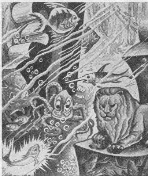
VI. Stančikaitė "Gintarėlės" iliustracija

Tėvų ir vaikų santykis šeimoje yra pagrįstas žmogaus santykiu su Dievu. Dievas mums yra aukščiausias autoritetas ir Dievas duoda žmogui didžiausią laisvę, bet laisvę — įstatymuose. Yra net pasakyta, kad "įstatymas jus padarys laisvus". Iš Dievo įstatymo išplaukia tėvų autoritetas ir iš žmogaus laisvės išteka vaikų laisvė. Tačiau tikrą laisvas ir už savo veiksmus atsakingas gali būti tiktai subrendęs žmogus. Brendimas vyksta tėvų priežiūroje, kuri vaikams darosi vis laisvesnė, juo daugiau jie įgyja sąmonės ir pajaučia atsakomybės. Pradžioje tėvų žodis yra griežtai įsakomas, nes juo valdomi instinktyvūs ir impulsyvūs vaikų veiksmi. Toliau tėvo ar motinos žodis darosi vadovaujantis ir išpėjantis, nes juo kreipiamasi į paties vaiko valdymąsi ir jo protinius motyvus. Pagaliau tasai žodis pasidaro maldaujantis, kaip ir Dievo, kada subrendęs vaikas jau turi savarankišką gyvenimą.