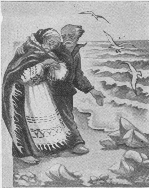
VI. Stančikaitė "Gintarėlės" iliustracija

kiny, į kurį metus ir nedidelį akmenėlį, ratilai nueina visu paviršiumi ir susiūbuoja nendrės.