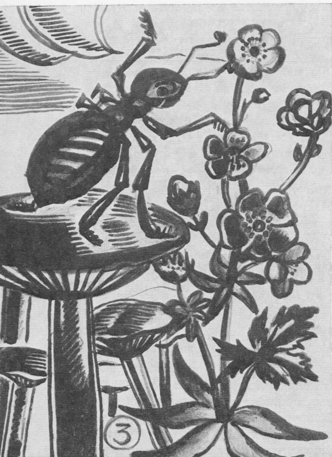
Iš pasakos "Voras ir skruzdėlė" iliustracijų (škiecas) P. Augius

būtų reikėję tos nevykusios, vaikiškos komedijos, kuri daug pakenkė šeimos laimei ir meilei.