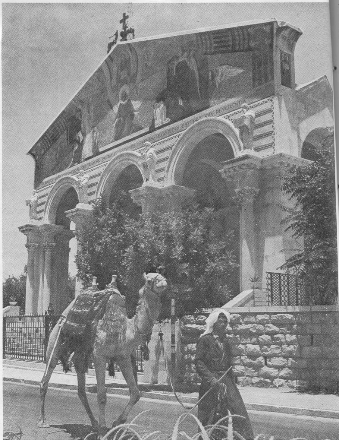
“Tautų” arba “Gethsemanės” bažnyčia Jeruzalėje.