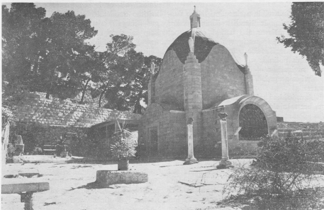
“Dominus flevit” koplytėlė.