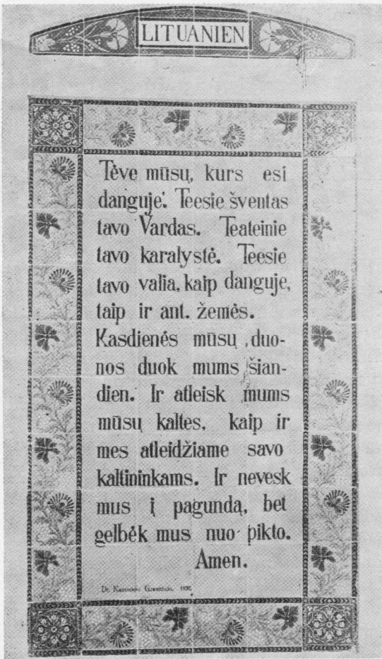
Lietuviškas Viešpaties maldos tekstas "Pater noster" bažnyčioje.

— juk tiek daug reikės matyti, apžiūrėti, apėiti, apvažinėti! Pirmasis sustojimas — Alyvų kalnas. Tai gana aukštas, ilgas kalnagūbris, nuo kurio atsiveria nuostabi Jeruzalės panorama. Džimis suranda gražiausią vietą, ir mes, ten susibūrę, nusifotografuojam. Šaltas vėjas taršo plaukus, skverbiasi pro švarkus, megztinius, bet mes, naujoms įdomybėms ir išgyvenimams pasiruošę, šypsomės, giliai įtraukdami kalnų žolelėm kvepiantį orą.