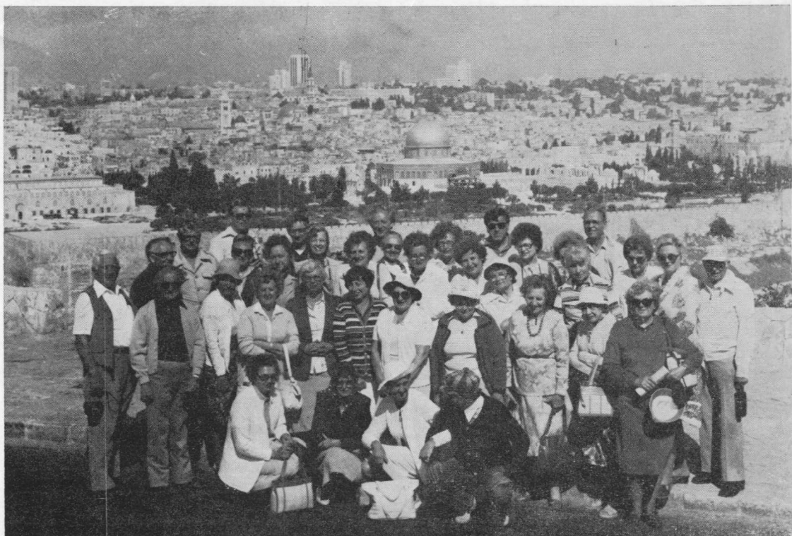
“Laiškų lietuviams” ekskursijos dalyviai prie Jeruzalės.