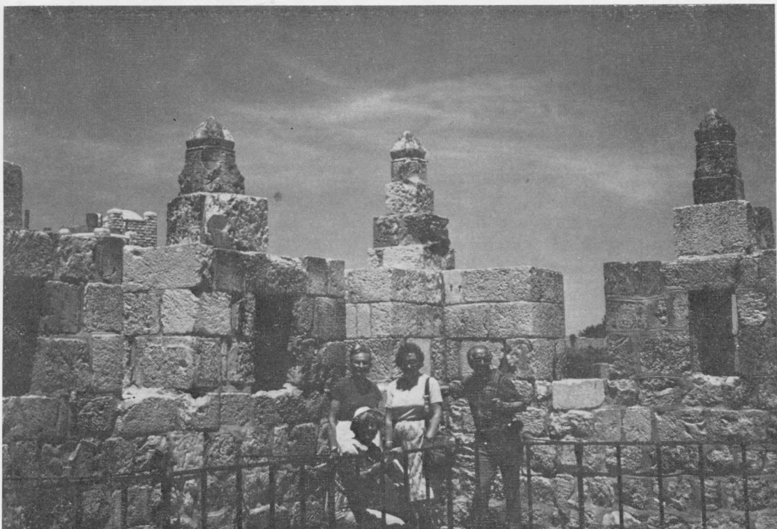
Dalis ekskursantų ant senosios Jeruzalės sienų.