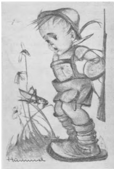
Eidamas užkariauti pasaulio, nusigando žiogelio...

Visa eilė žurnalistų, keliavusių po Sovietų Sąjungą, liudijo, kad dauguma žmonių, po 40-jų amžiaus metų, kreipiasi į religiją. Paklausti, ar tai bendrinis faktas, ar pastaba, liečianti tam tikrą žmonių kategoriją, jie atsakė, kad susidomėjimas religija pastebimas visų profesijų vyruose ir moteryse, valdininkuose, kooperatyvų ir unijų pareigūnuose, kolektyvinių ūkių personale ir darbininkuose. Toks atsakymas atrodė per daug bendrinis. Bet laikraštis TRUD (birželio 29) rašė: "Gaila, bet dar vis galima matyti inžinierių, daktarų, Komsomol ir unijų pareigūnų bei aktyvistų, dalyvaujančių religinėse apeigose religinių švenčių proga. Daugeliui dar tebeatrodo natūralu dalyvauti krikštynose, nueiti į cerkvę laidotuvių ir sutuoktuvių proga. Teisinama-