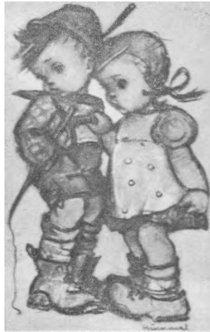
Vienodi interesai, rūpesčiai ir vargai...

1. Teoriškai tėvų ir vaikų santykius iš esmės kitaip formuluoja čia vyraujanti pragmatinė filosofija ir jos sukurta natūralistinio vaikocentrinio auklėjimo teorija. Tiesa, ta natūralistinio auklėjimo teorija nėra Amerikos išradimas. Ji buvo sukurta Europoje, ir žymiausi jos autoriai buvo europiečiai J. J. Rousseau, E. Key, L. Tolstojus. Bet ten ji neprigijo ir auklėjimo revoliucijos ten nepa-