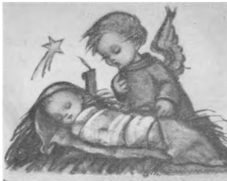
Kūdikis ir angeliukas.

Kartą tautų Apaštalas rašė: "Jei net angelas iš dangaus jums skelbtų kitą Evangeliją – netikėkite ir jos nepriimkite." Mums ir šiandien nesu-