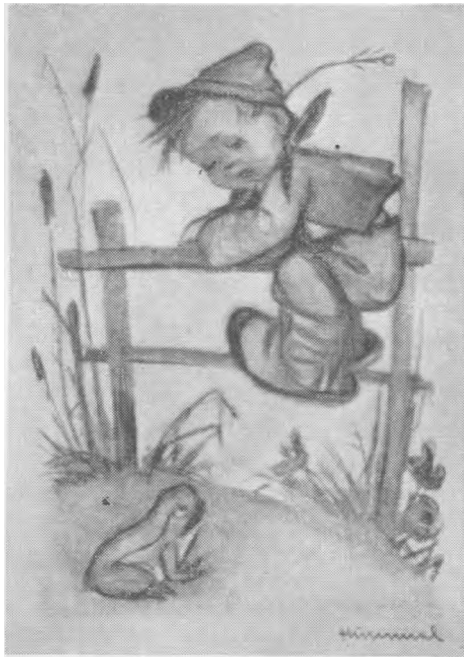
Ar ta biauzybė manęs nepasieks?