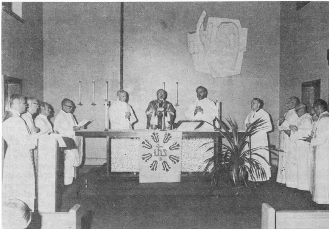
Jėzuitų generolas P.H. Kolvenbach koncelebruoja mišias su lietuviais jėzuitais jų koplyčioje.