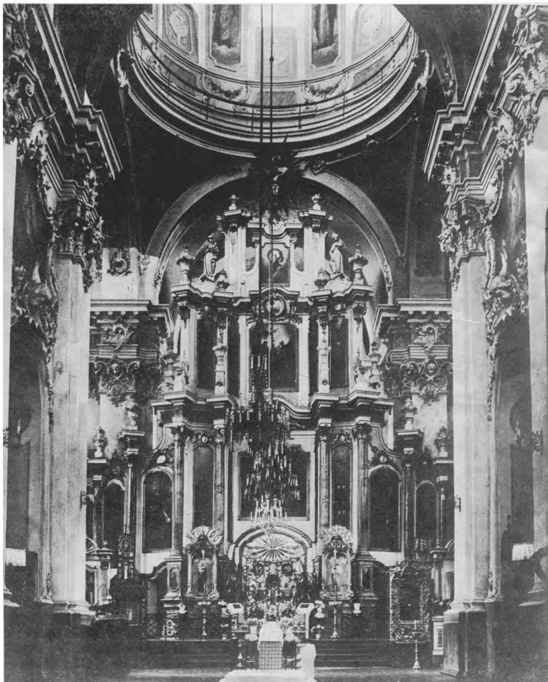
Šv. Dvasios cerkvės Vilniuje ikinostasas (architekt. J.K. Glaubicas). "Vilniaus architektūra", Vaga, Vilnius 1978.