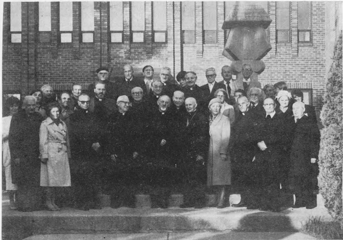
Jėzuitų generolas P.H. Kolvenbach su mišių dalyviais Jaunimo centro sodelyje prie Laisvės kovų paminklo.