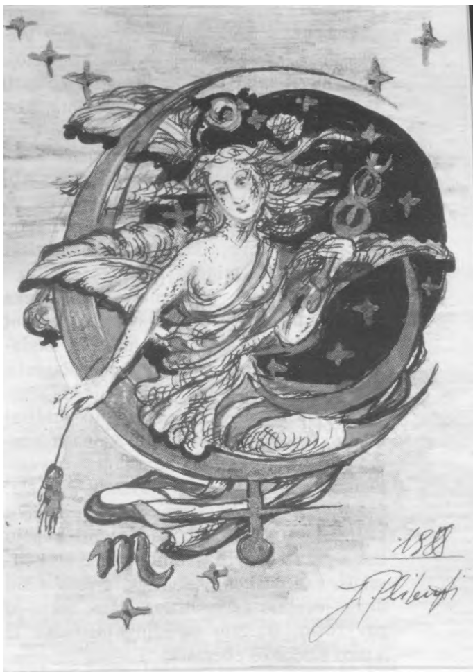
Zodiako ženklai, Virgo

Jaunuoliui augant, jo pažintys vis plečiasi, lyg vandens ratilai, įmetus į upę akmenį. Kiekviena pažintis jį kitaip veikia, ir jis ima suvokti, kad jis suaugusiųjų nesupras, kol pats nesubręs ir netaps suaugusiu. Tai yra labai svarbu pastebėti, nes vyresniesiems yra lengviau jaunimą suprasti — juk jie patys jauni buvo, o jaunimas tik gali šiaip taip įsivaizduoti, ką reiškia būti suaugusiu.