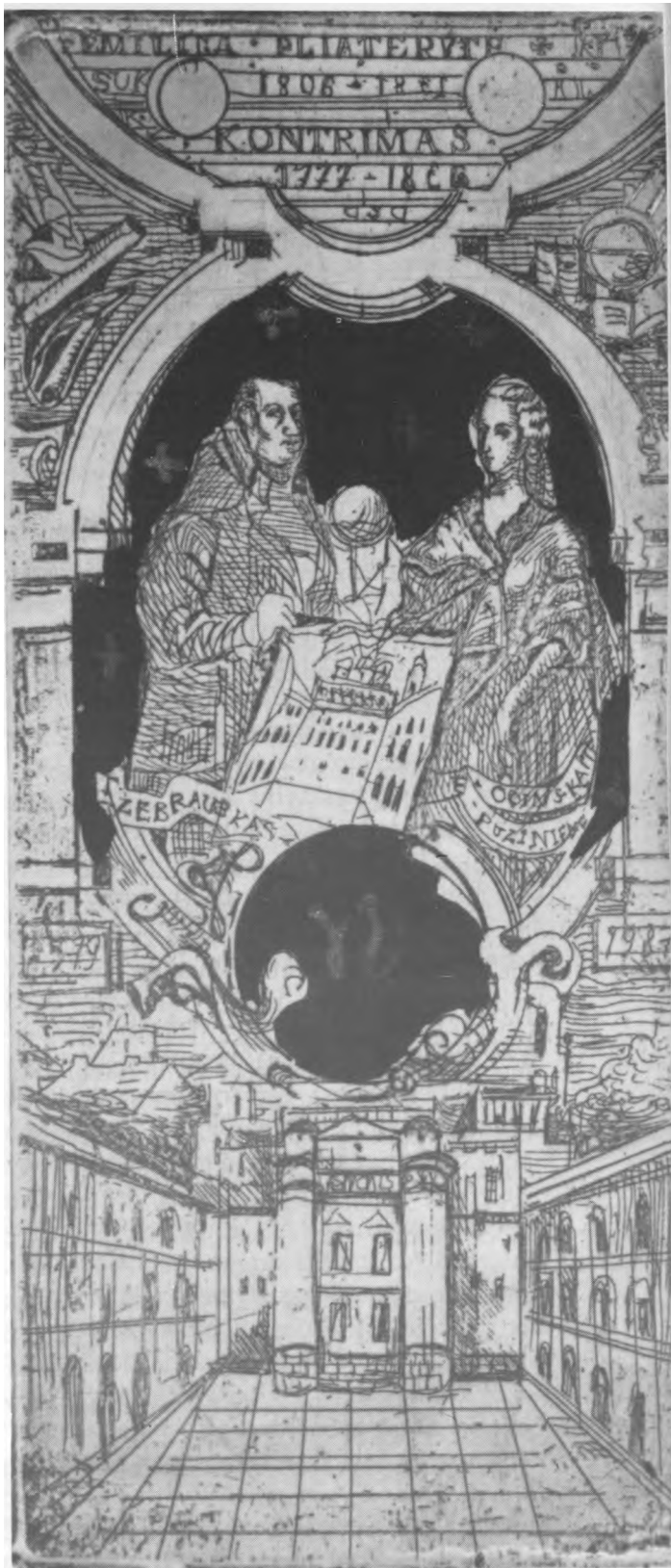
Vilniaus universitetas, 1987 J. Plikionytė

Galilėjos žemėje Jėzus dar kartą padarė pranešimą apie savo kentėjimą ir mirtį.