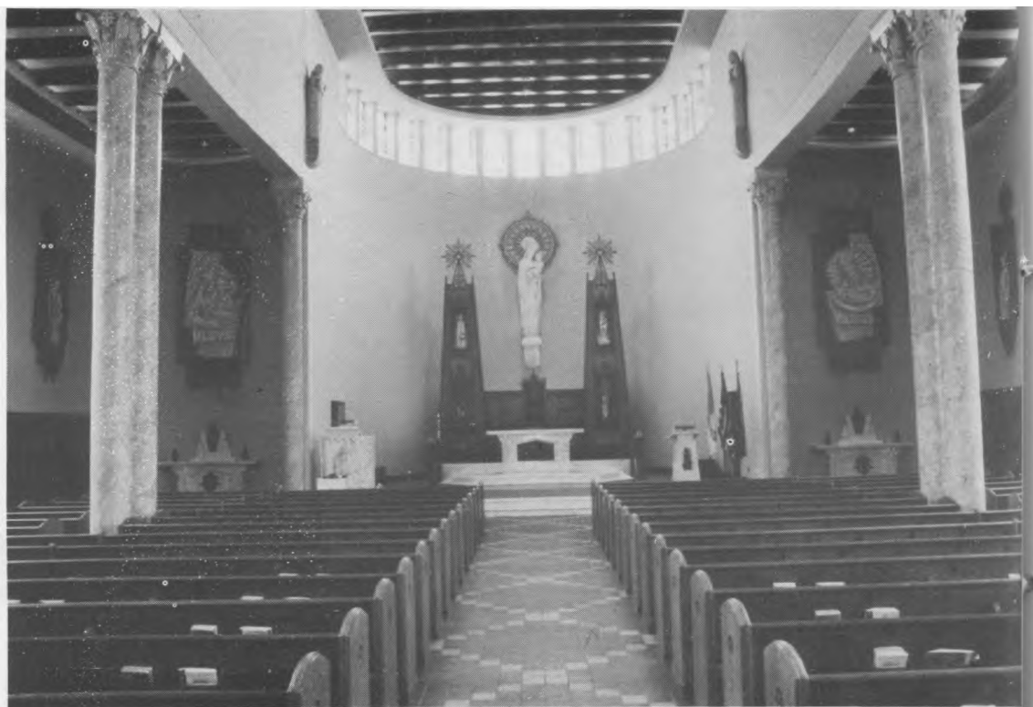
Bažnyčios vidus ir didysis altorius, už jo — dekoratyviniai koplytstulpiai ir juos jungianti lentynėlė, viduryje — Madonos skulptūra ir ornamentinė medžio, audinio bei Lietuvos gintaro saulė

tarpi vadina savęs ieškojimo tarpsniu, tačiau daugiausia jo elgesį, kalbėjimo būdą, apsirengimą ir pomėgius valdo “bandos instinktas”, t.y. noras niekuo nesiskirti iš kitų bendraamžių, iš draugų. “Visi taip daro” — yra jo gyvenimo motto.