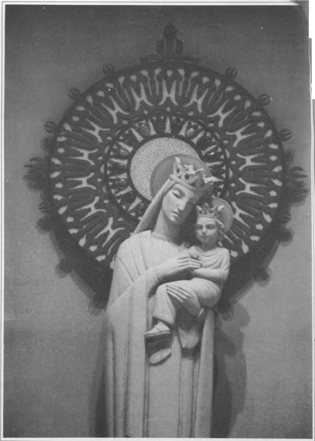
Madonos skulptura už didžiojo altoriaus su ornamentine medžio, audinio ir Lietuvos gintaro saule