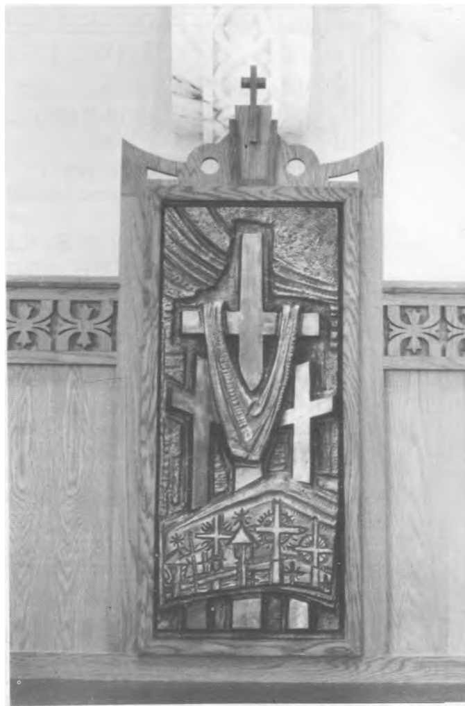
Centrinės dekoratyvinės lentynėlės, jungiančios koplytstulpius, Trijų kryžių ornamentas

Yra laiškų, kuriuos gal sunkiau parašyti, rečiau prie jų prieinam, tačiau jie