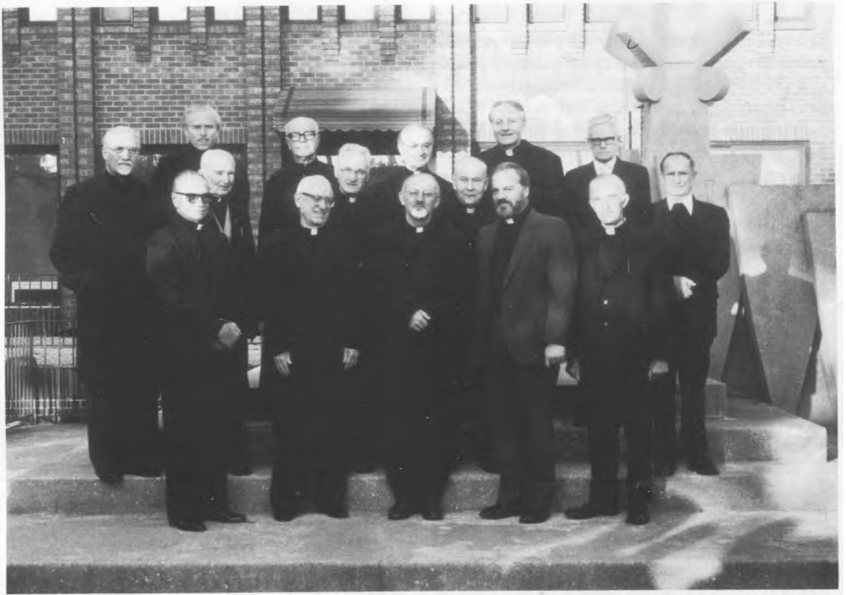
Jėzuitų generolas Peter-Hans Kolvenbach su lietuviais jėzuitais Čikagoje