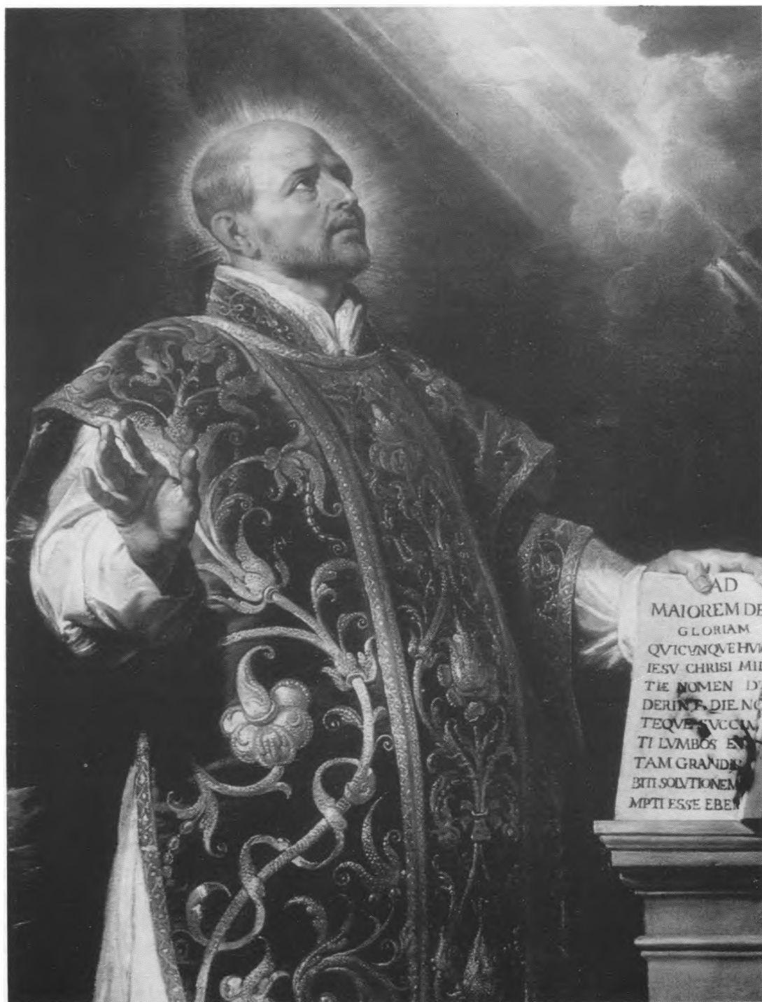
Šv. Ignacas Lojola