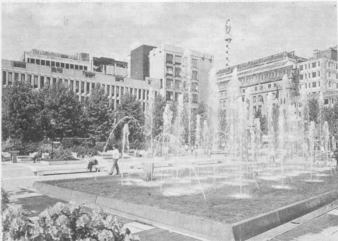
Karališkieji sodai Stokholme.

vyro baidos alkoholizmo ligos. Aš buvau arti desperacijos. Dabar jaučiu paguodą, ramybę ir džiaugsmą kiekvieną dieną, patirdama savo gyvenimą esant Dievo rankoje”.