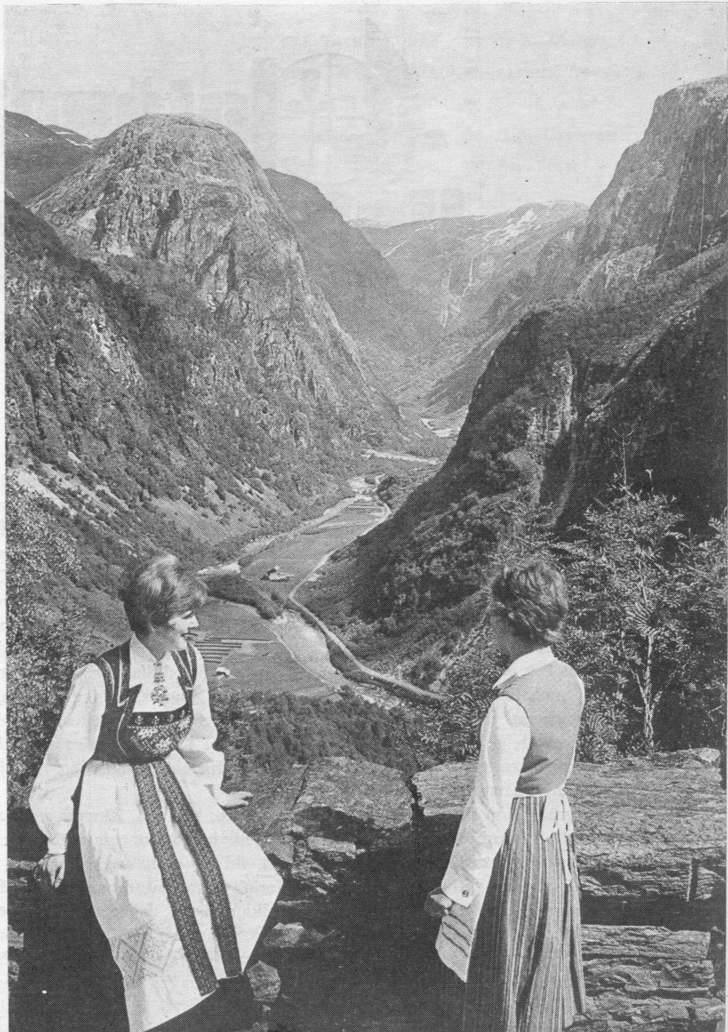
Norvegēs ir Norvegija.