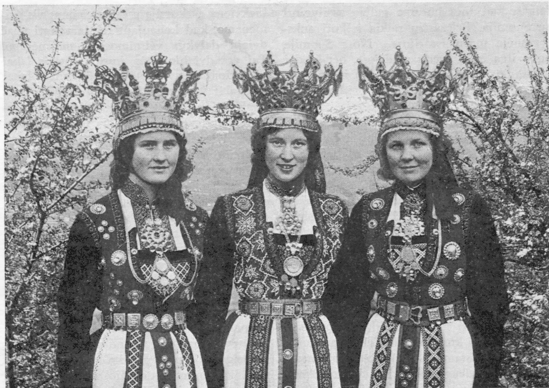
Norvegių vestuviniai drabužiai.

buvo atneštas tortas ir pasveikintas vienas keleivis, kuris tą dieną šventė savo gimtadienį. . . Vis dėlto kai kurios tos grupelės narės ir toliau nenorėjo prisipažinti prie savo klaidingo įtarimo ir dar vis mano, kad čia galėjo būti ir kitų tikslų. . .