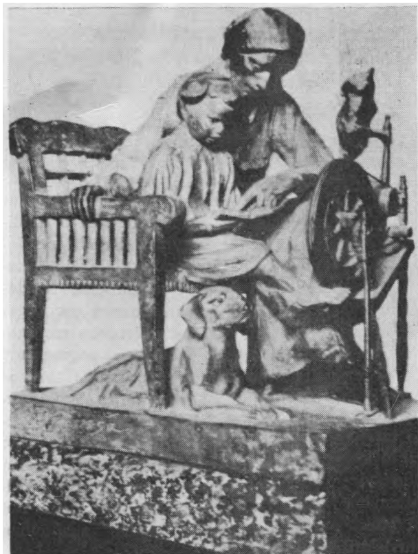
PETRO RIMŠOS "Vargo mokykla"

kurios dar buvo užsilikusios nuo Vilniaus Mokyklų Kuratorijos laikų.