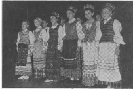
Vaikų Ansamblio dalyvės Čikagoje.

Kas gi žmones jungia? Pirmoje eilėje, žmogiškoji prigimtis. Nesvarbu, kokia žmogaus spalva, rasė, kraujas, kokia kalba, tikėjimas, koks turtas ir socialinė padėtis – kiekvienas žmogus turi tą pačią prigimtį, kuri visus žmones jungia stipriau ir arčiau negu bet kas kita šioje žemėje. Kai keičiasi valstybių sienos, gimsta ir miršta kultūros, kyla ir griūva imperijos – žmogaus prigimtis lieka esmingai ta pati. Net kai tautos, kalbos nyksta, vienišos stovi faraonų piramidės, ir į dangų stiebiasi inkų ir actekų apleistieji paminklai – žmogaus prigimtis esmingai nesikeičia. Ji ne tik nesikeičia, bet net šiandien mums neklaidingai skelbia, kad Dievas ją sutvėrė į savo paveikslą ir panašumą. Ir šioje žmogaus prigimtyje, kuri lieka vis ta pati, nyksta skirtumai,