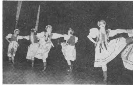
Vaikų Ansamblio šokėjos.

Ar tokie reiškiniai neturėtų sukelti net ir nefanatiškiems netikintiesiems