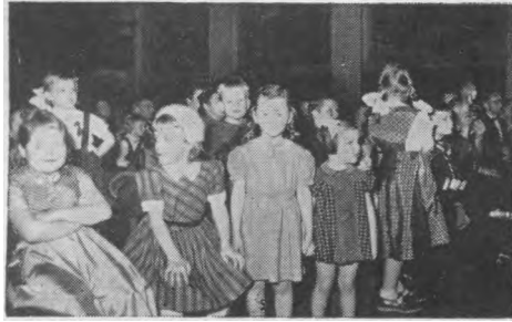
Mažieji vaikų ansamblio žiūrovai.

kad, jei žmogus neranda šioje žemėje savo gyvenimo įprasminimo, nusiramino ir pilno pasitenkinimo, tai to įprasminimo reikia ne žemėje, o kur nors kitur ieškoti? Jei žemiškos gėrybės žmogaus nepatenkina, tai turi būti kokia nors kita nežemiška gėrybė, kuri pajėgtų jį patenkinti. Argi neturime teisės galvoti, kad jei žmogaus širdis to įprasminimo ir pasitenkinimo ilgisi, tai turi būti kas nors šalia žemės, kas galėtų jo gyvenimą pilnai įprasminti, nes įgimti prigimties palinkimai ir nujautimai negali būti beprasmiai? Jeigu jau kompasu adatėlė nerimauja, iki atsisojia viena jai skirta kryptimi, kuri egzistuoja ir ją pilnai nuramina, tai ar neturime pagrindo galvoti, kad ir žmogaus širdies ilgesys bei nerimas ir nepasitenkinimas šia žeme šaukiasi ko nors, kas turi būti ir tą širdies ilgesį gali nuraminti?