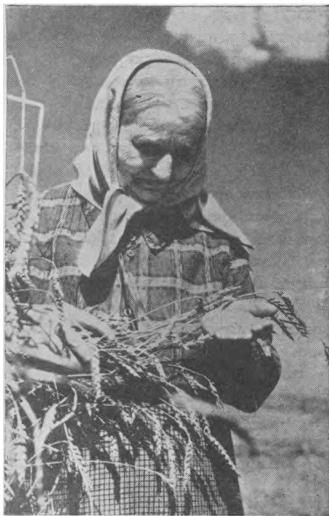
Rudens nuotaikos Lietuvoje

je. Krikščionybės istorijoje mergystė visada reiškė visišką savęs atidavimą Dievui. Kaip mergystė siekia pačios "pradžios" ir kaip ji stengiasi atstatyti pirmąsias, suderintąjį Dievo pilnai sutvarkytąjį ir dvasiškai suformuotąjį žmogų, taip ji žvelgia ir į ateitį, tikėdama ir vildamasi iki "galo". Ji supranta, jog "laikas yra trumpas, todėl lieka ir tiems, kurie turi žmonas, gyventi taip, lyg jų neturėtų; ... nes šio pasaulio išvaizda praeina. Aš gi noriu, kad jūs būtumėte be rūpesčio" (1 Kor. 7, 29-30). Kaip mergystė siekia atbaigtos meilės, taip ji nori gyventi pilnutiniu tikėjimu bei vilties gyvenimu ir padaryti paskutines išvadas iš Evangelijos.