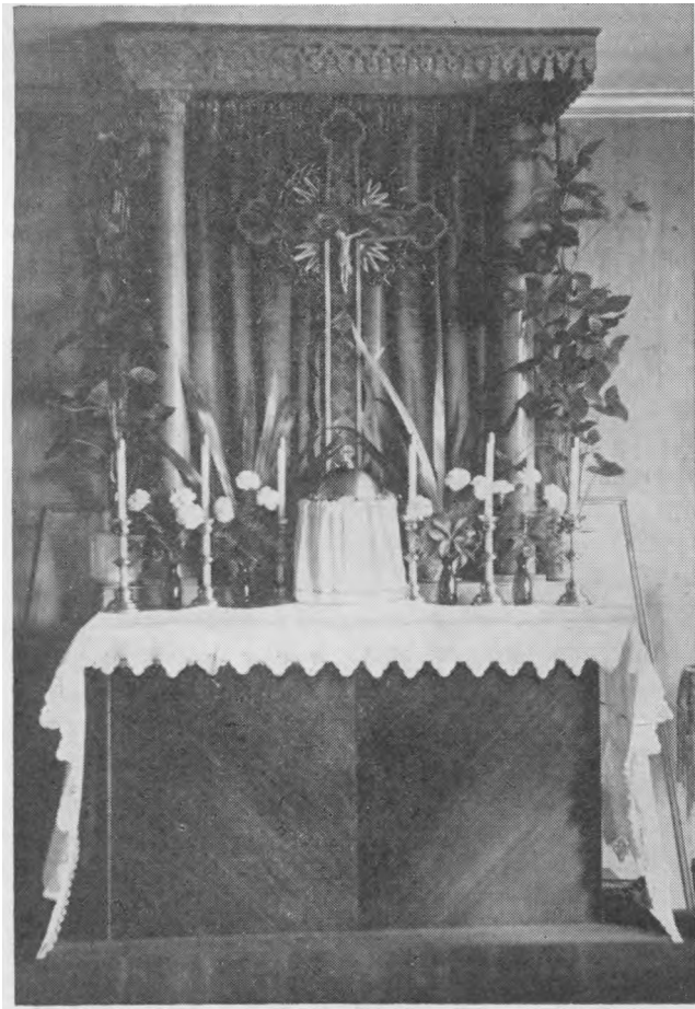
Lietuvių jėzuitų koplyčios Čikagoje didysis altorius.

tarp dogma pagrįstos religijos ir pasaulietiškos naudingumo galvosenos turėjome tam tikrą ryšį, kuris yra kilęs karalienės Viktorijos laikais, būdingas savo kompromistiškumu. Bet tai buvo nenatūralus ryšys ir jis neįstengė atsispirti didėjančiam pasaulietiška nusistačiusios kultūros spaudimui. O tuo laiku, kada šitas tuščias naudingumo principas jau buvo visuomenės auklėjime pakeistas humanistiniu idealu — pats humanizmas prarado savo garbę ir įtaką aukštesniajam lavinimui. Kada kultūros idėja buvo atpalaiduota nuo