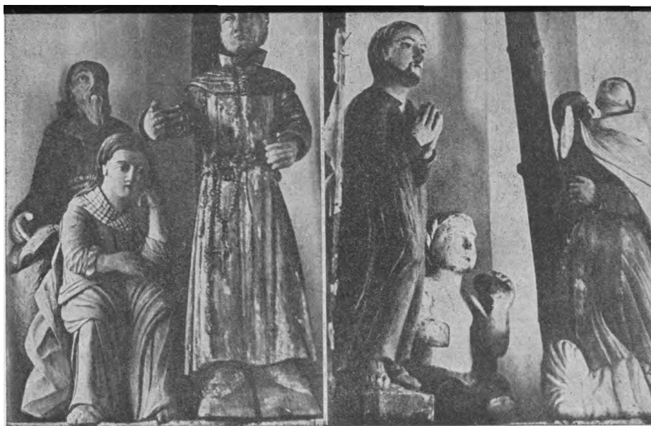
Šimtmetis senis ant tėvelio dvaro Drožia dievuliuką, kurs stebuklus daro. Kai iš ūkio sūnų Sibiran išleido, Tas kančias ir drožia Viešpačiui ant veido. (F. Kirša)

kurie dalykai per vėlai pasiekia Bažnyčios vyresnybę; tada, kai priemonės jau nebegelbsti arba kai jos per lėtai taikomos, nuo blogybės jau nebeapsisaugoma. Nuomonė, kad Bažnyčios autoritetai ir kunigai patys geriausiai gali susitvarkyti. Bažnyčios istorijos nėra patvirtinta. Ji rodo, kad negerovės Bažnyčioje kartais buvo pašalintos tik tada, kai Bažnyčios priešai iš jų jau buvo padarę geriausią progą ją pulti; niekas negalės ginčyti, kad Bažnyčią tokie dalykai žemina.