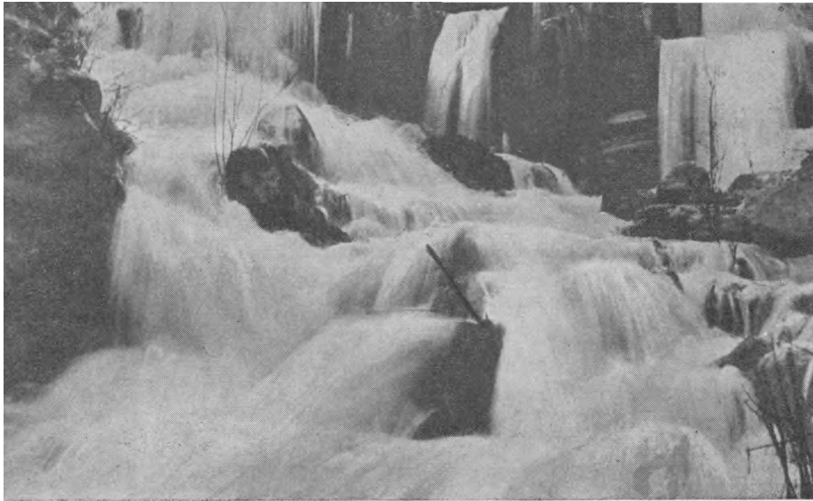
Seiros upelis (Veisiejų apskrityje)

Kaskados baltos teškia Perlus po mūsų kojų — Surinki juos ir neški Papuošti mūs rytojų!