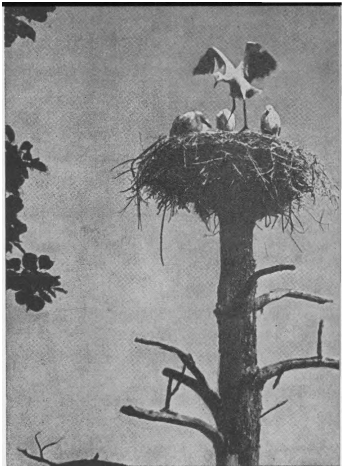
Garny, garny, ga, ga, ga ...

Patys amerikiečiai nesuprato, kokią naudą ateiviai šiam kraštui davė, atsiveždami su savim savo šalies kultūrą, tradicijas, ir tėvų kalbą. Kai įvai-