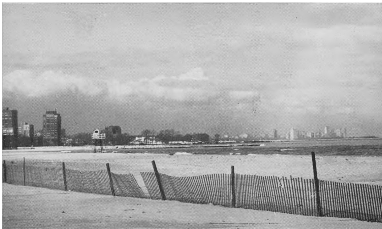
Didmiesčių vasaros tvanka ...