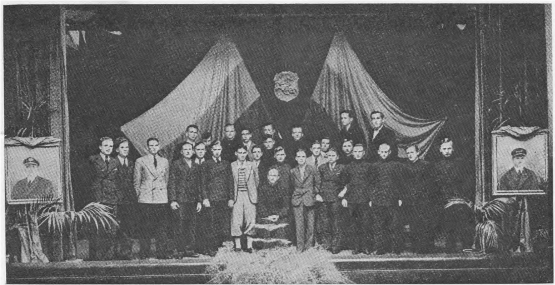
Dariaus ir Girėno minėjimas Jėzuitų gimnazijoje.