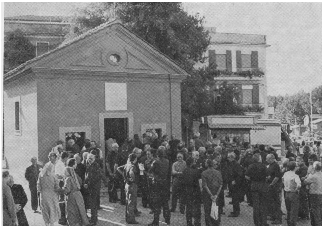
Jėzuitų seimo dalyviai prie La Storta koplyčios.

prieš pat įrašydamas asmens vardą į balso lapelį.