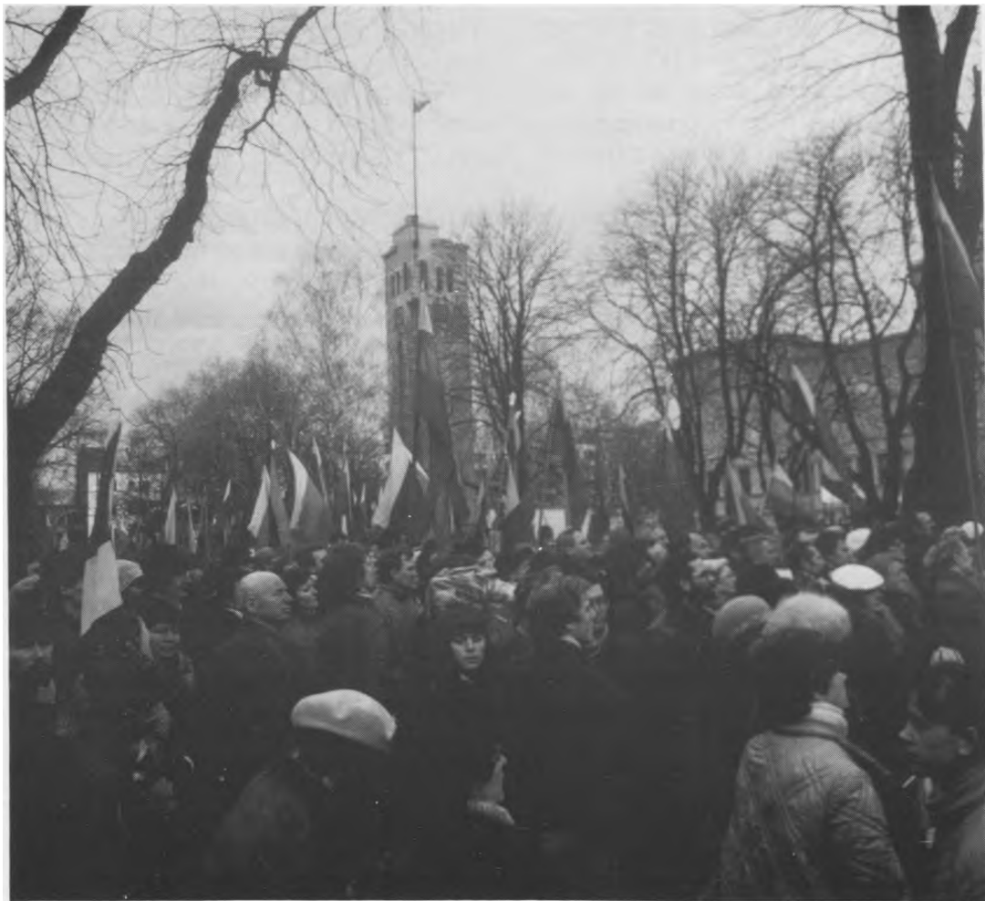
Vasario 16-oji Kaune