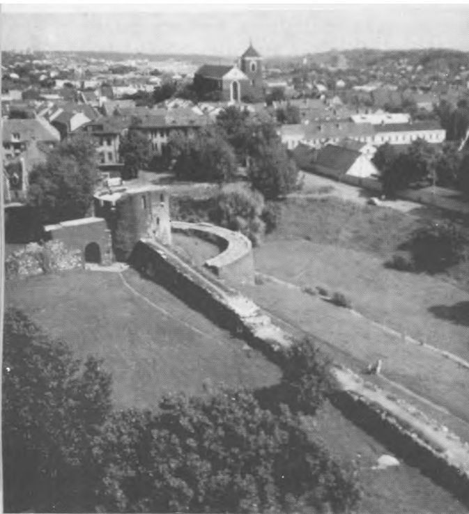
Čia prasideda Kauno miesto istorija: pilies liekanos (13 a.)

ir toliau: 'Viešpats žino išminčių mintis — kad jos niekingos' (Plg. Job. 5, 19; Ps 93, 11). Tad niekas tenesididžiuoja žmonėmis" (1 Kor 2, 10; 3, 18).