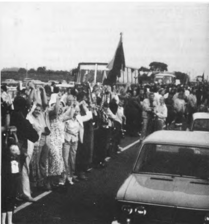
Gyvasis Baltijos kelias