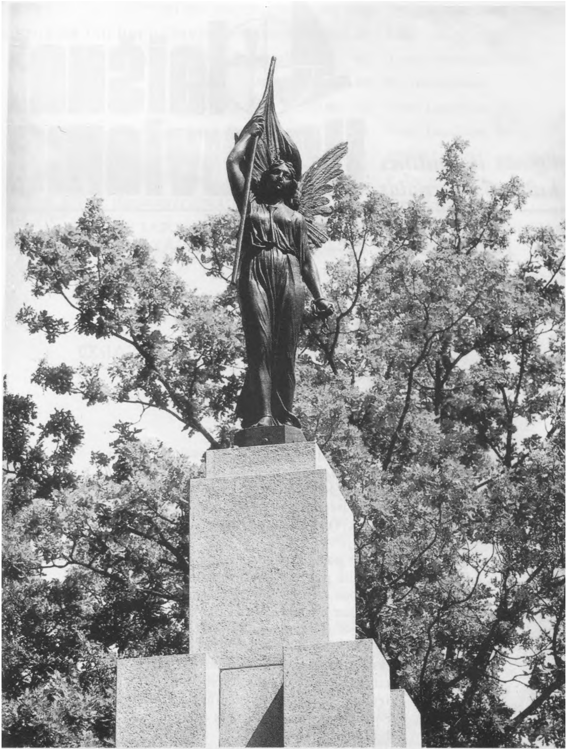
Atstatytoji Laisvės statula (skulptorius J. Zikaras)