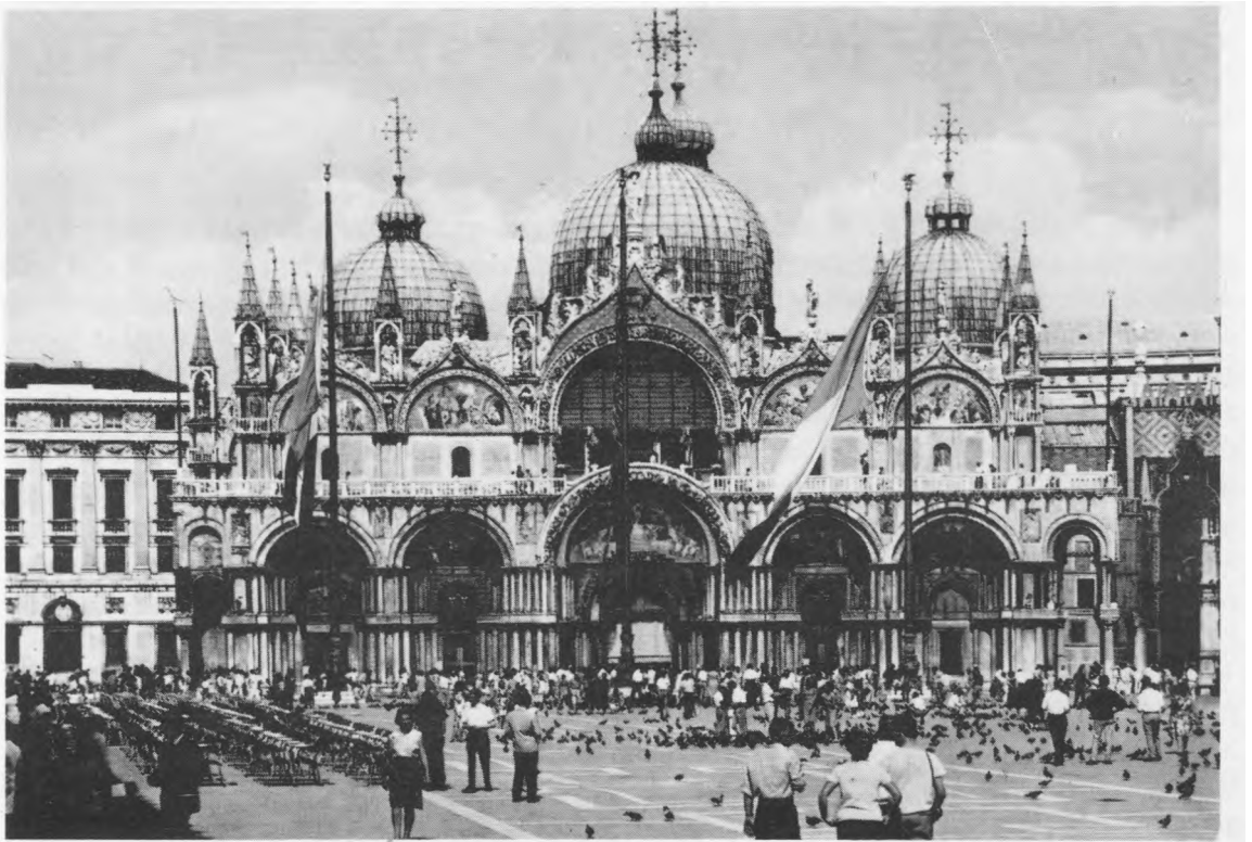
Šv. Morkaus bazillika.

mu ir savąja formų derme tarsi netylančio lig mūsų dienų Venecijos garso, didybės ir vis dar neblėstančios urbanistinės šlovės simbolis! Gal ir anuomet kur nors po šiuo ar kitu portiku, prie kurio nejučiomis atsiremi, žiūrėdamas į trapius, tarsi Vilniaus Šv. Onos bažnyčios gotinius, nutįsusius į žydrą padangę bokštelius, ir tada buvo prisiglaudęs Ignacas Lojolą. Gal jis čia ramiai kramtė gailestingo venecijiečio padovanotą duonos žiauberę. O galbūt susisupęs į savo palaikį apsiaustą, kaip dabar benamiai, neretai pasitaiką didmieščiuose, kur nors tysojo po anuo skliaustu. Rasi, ir Ignacas, eidamas per šią simetriškai taisyklingą, priešais Dožų rūmus plytinčią ir su aiškiu skonio pajutimu sumanytą gan erdvią aikštę, kur tiek balandžių kasdien be at-