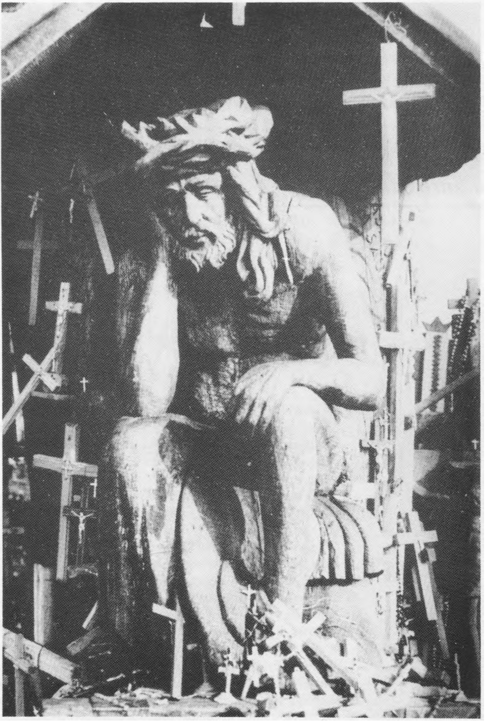
Rūpintojėlis — Lietuvos kančių simbolis.