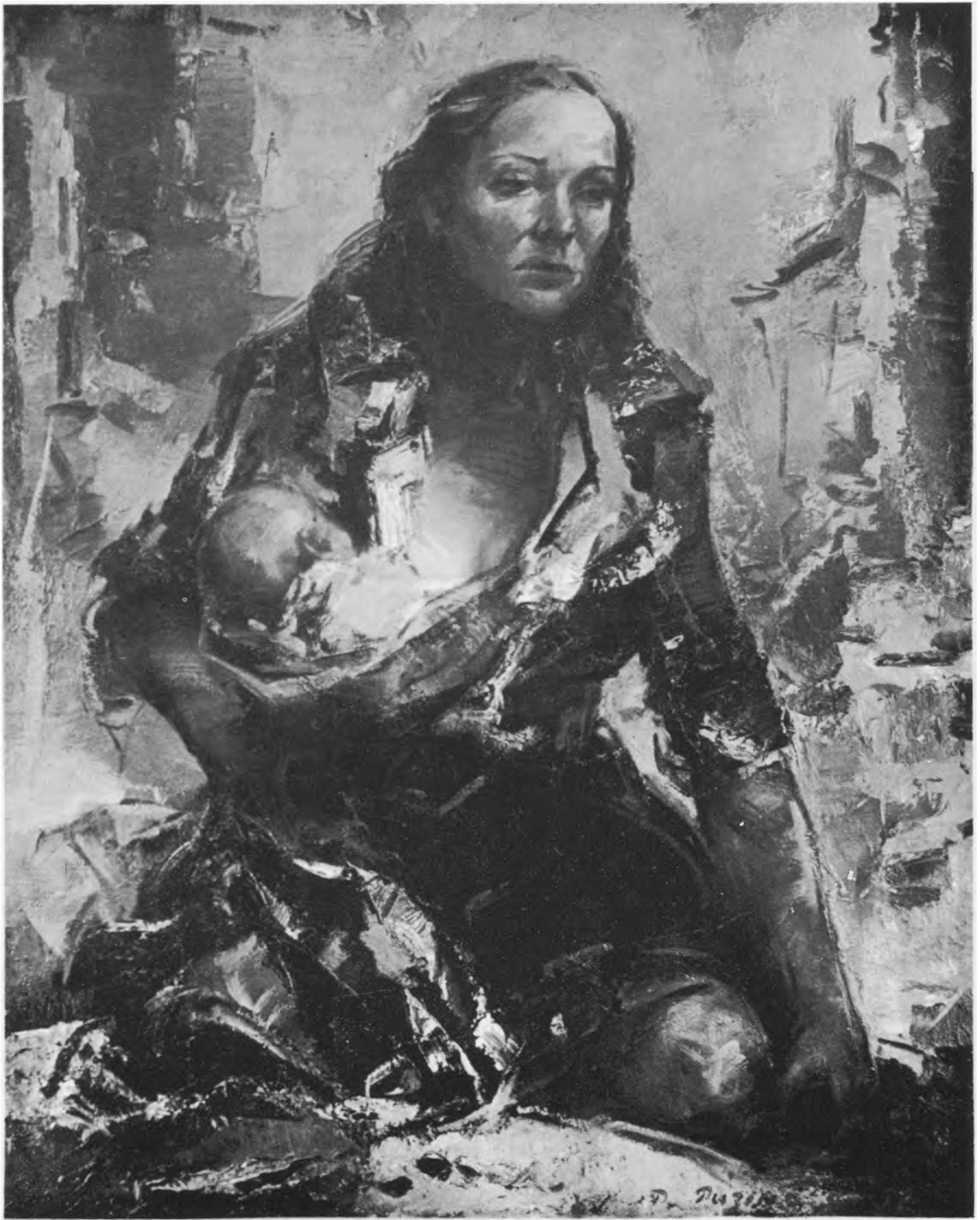
XX amžiaus motina.