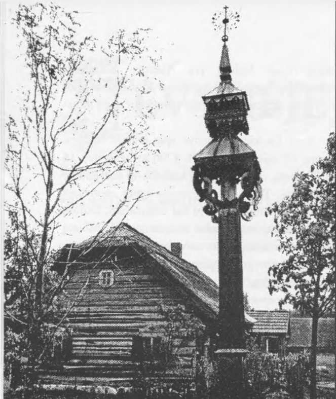
Pakelės kryžius Rumšiškėse.