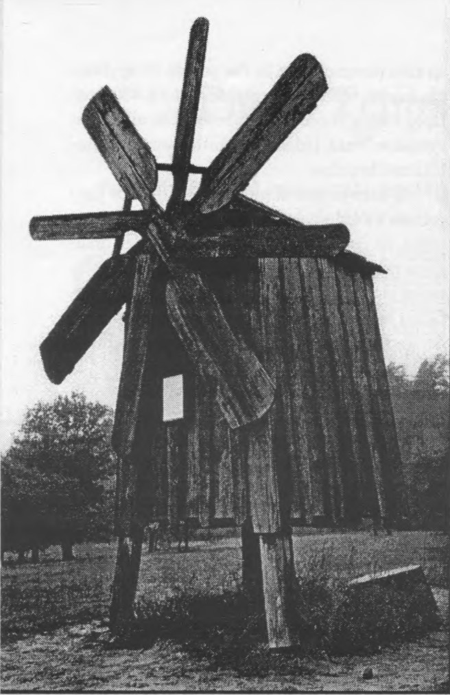
Senasis vėjo malūnas Rumšiškėse.