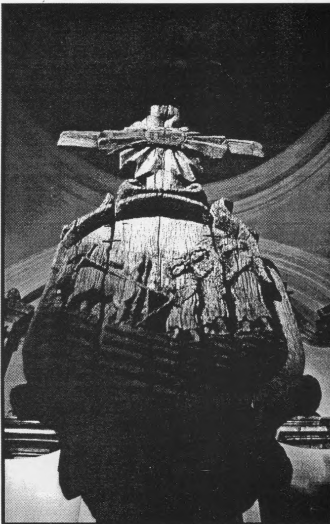
Senas Svirskio kryžius Vilniaus liaudies meno muziejuje.

Tos naujos Sąjungos su dangumi užuomazga ir buvo negausi krikščionių bendruomenė, deganti tarpusavio ir Dievo meile, toji trapi ir