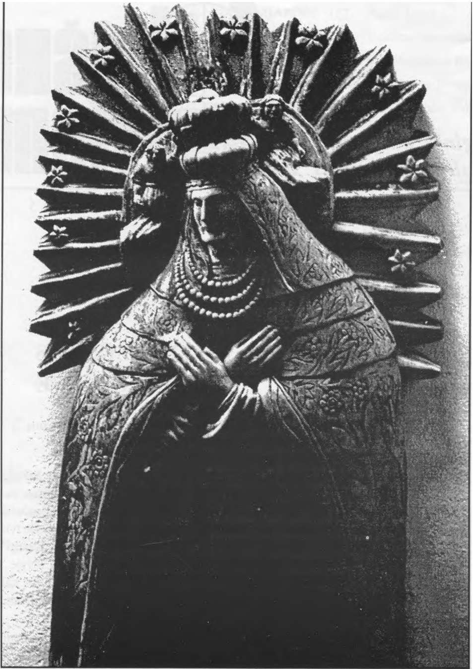
Aušros Vartų Marijos skulptūra Vilniaus liaudies muziejuje.